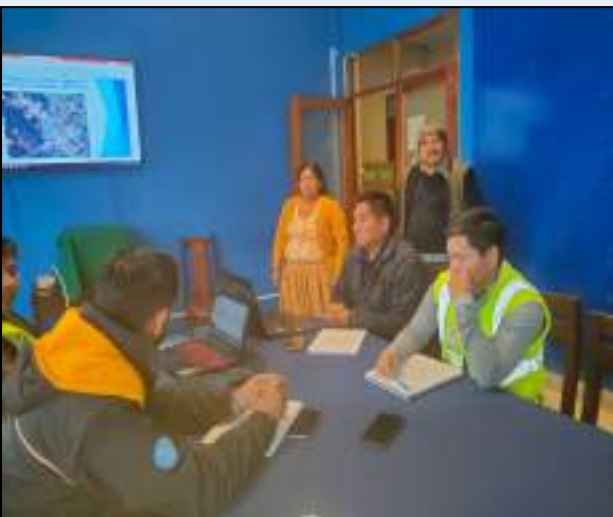
EN FECHA 09/05/2023: “Participación en la reunión con ABC en la ciudad de Cochabamba”.