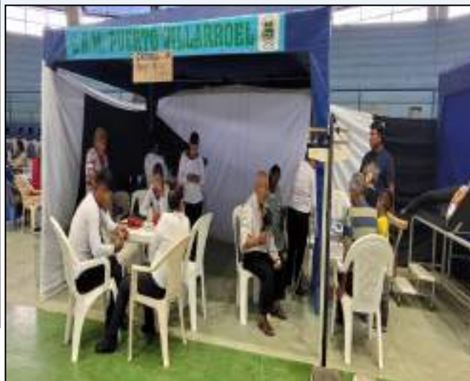
EN FECHA 05/04/2023: “Participación en la Campaña de Salud para adultos mayores en el Coliseo Cerrado de Ivirgarzama”.