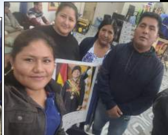
EN FECHA 06/05/2023: “Participación en el Ampliado Ordinario de la Federación Sindical de Comunidades Interculturales Carrasco Tropical”.